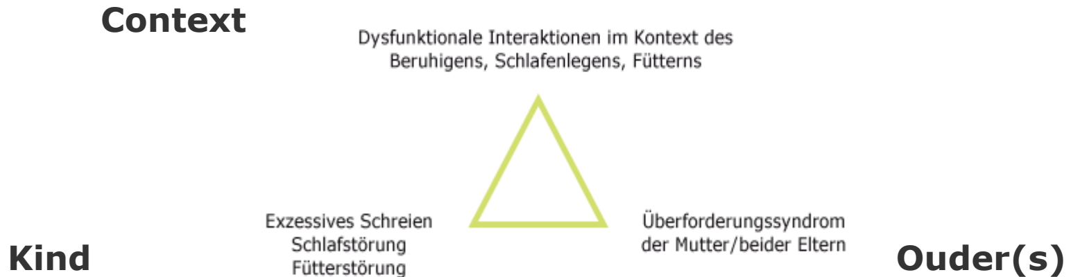
Figuur 2: Trias van Papousek

Diagnostische Trias der frühkindlichen Regulationsstörungen (Definition nach Papoušek et al.)